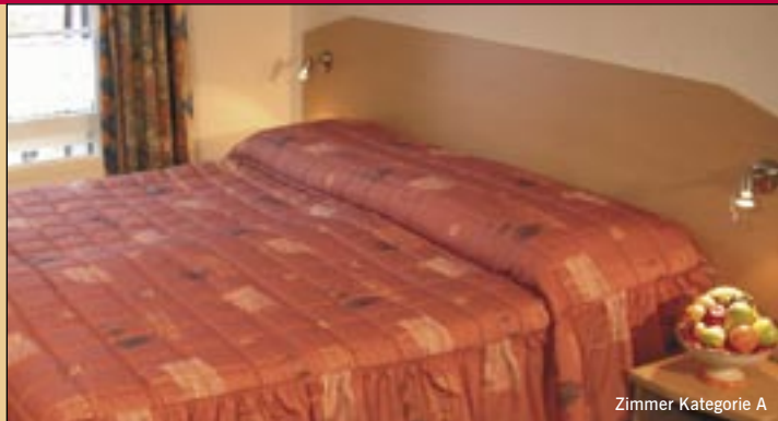
Zimmer Kategorie A